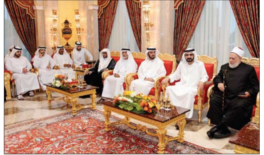
محمد بن راشد خلال استقباله العلماء ضيوف رئيس الدولة وعضء لجنة التحكيم في جائزة دبي للقرآن الكريم (وام)

بن زايد آل نهيان ممثل الحاكم في المنطقة الغربية وسمو الشيخ طحنون بن محمد آل نهيان ممثل الحاكم في المنطقة الشرقية وسمو الشيخ سيف بن محمد آل نهيان وسمو الشيخ نهيان بن زايد آل نهيان رئيس مجلس أمناء مؤسسة زايد بن سلطان آل نهيان للأعمال الخيرية والإنسانية والفريق سمو الشيخ سيف بن زايد آل نهيان نائب رئيس مجلس الوزراء وزير الداخلية وسمو الشيخ عبدالله بن زايد آل نهيان وزير الخارجية. (التفاصيل