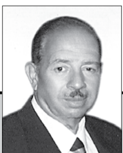
موسى الذي مسه نور من الله