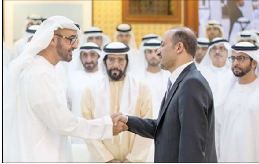
محمد بن زايد يصافح رئيس الائتلاف السوري بحضور طحنون بن محمد وحمدان بن زايد