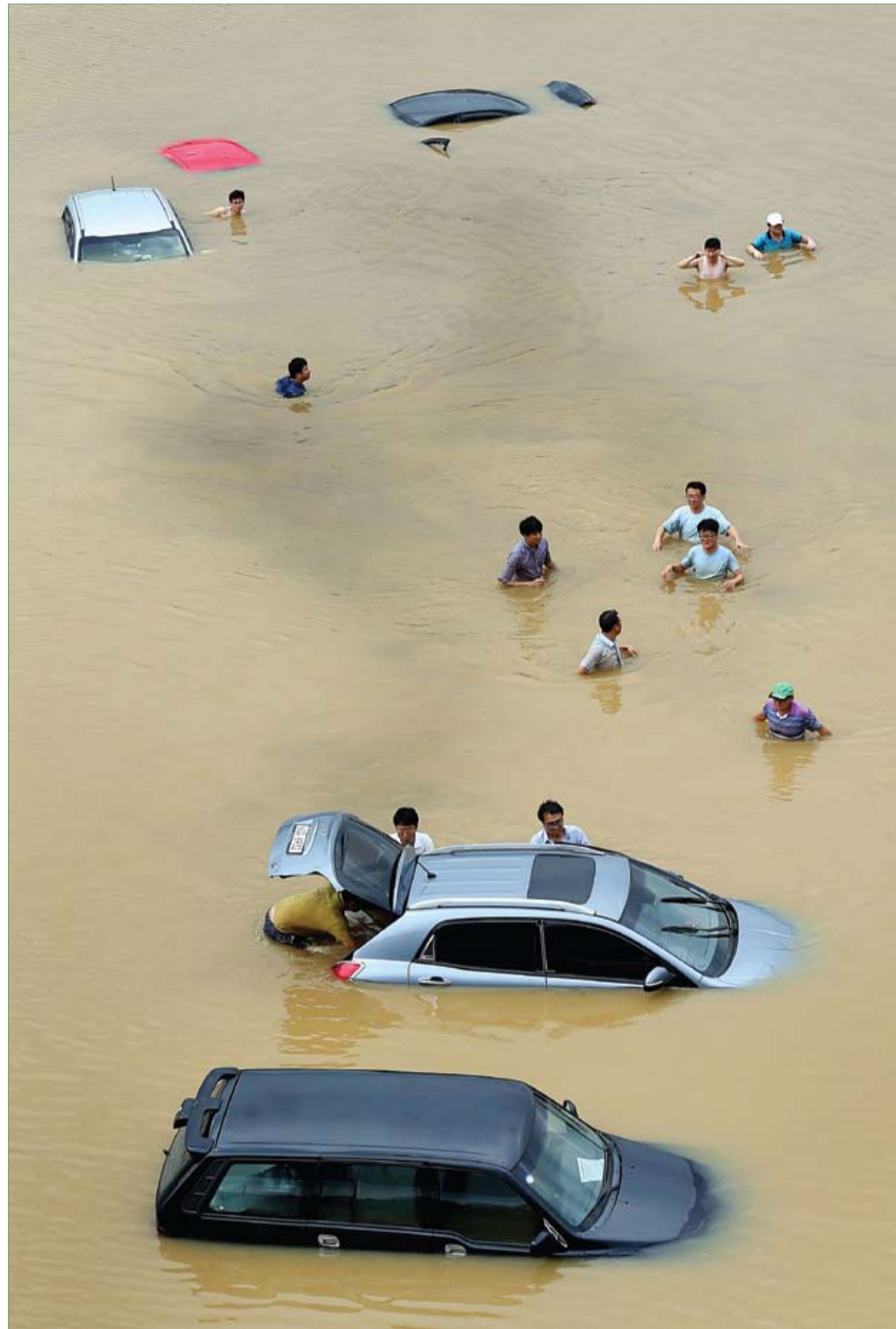
مجموعة من الشباب يحاولون تحريك سيارتهم التي غمرتها مياه الأمطار الغزيرة الى جانب سيارات أخرى في أحد شوارع مدينة سيول.

نجحت فرق الإنقاذ في الصين في انتشال طفل في الخامسة من عمره، كان على حافة الموت، عندما علق رأسه بين شتاي حديد شرفة منزله. وفي الوقت الذي توقع فيه الجيران أن سقوط الطفل أمر حتمي، وقضوا ينتظرونه تحت الشرفة ممسكين بأيديهم قطعة كبيرة من القماش ليجنبوه الارتطام بالأرض، حسبما ذكرت صحيفة لتغاراف البريطانية، وكان الطفل يبحث عن أمه في المنزل، وعندما لم يجدها هرع إلى النافذة ليبحث عنها، وهو ما أدى به ليعلق بين أسوارها، ثم تبين بعد ذلك أن الأم تركت صغيرها في المنزل وذهبت لقضاء حاجاتها من السوق.