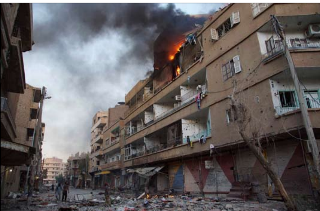
خلالها على تأثير الصراع السوري على الأطفال الذين يعيشون في سوريا والمنطقة. واختتمت زيارة للمنطقة شملت سوريا والأردن والعراق وتركيا ولبنان، اطلعت جميع أطراف النزاع . وكانت المثلة الخاصة للأمم العام قد اختتمت زيارة للمنطقة شملت سوريا والأردن والعراق وتركيا ولبنان، اطلعت

ولفتت إلى انه من ناحية المعارضة فهم يختلفون من حيث من هم وأين هم وما هي قوانينهم، وهم كلهم مدرجون على قائمة العار ، فالمعارضة متهمه بتجنيد الأطفال، أما الحكومة فيسبب القتل والتشويه والعنف الجنسي والهجوم على المدارس والمستشفيات . وقالت أنا أرى الآن كيف أصبح المجتمع مستقطبا منذ زرت سوريا في كانون الأول ديسمبر، فمن السهل رؤية من يساند المعارضة ومن يؤيد الحكومة السورية، يجب أن يفهم الجميع انه من الصعب أن تجمع السوريين مع بعض قبل أن يفهموا أولاً أن لا مكافأة للفوز بسوريا . وأشارت زروقي إلى صعوبة الوصول إلى الداخل السوري والصعوبات التي تواجهها المنظمات الإنسانية في الوصول إلى المناطق السكنية المتضررة. وحذرت من انه انه إذا استمر هذا الوضع فسوف يظهر جيل جديد من الأميين ، مؤكدة ان الحل السياسي هو الطريق الوحيد لإنهاء الصراع في سوريا .