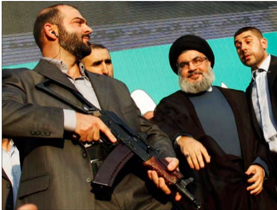
وساهم هذا التدخل العسكري في الشؤون السورية في اقتاع بعض الاوروبيين بالموافقة على ادراج الحزب الارهابية وحدت حذوها بريطانيا وهولندا على لائحة المنظمات الارهابية.

رحبت المعارضة السورية بقرار الاتحاد الاوربي إدراج الجناح العسكري لحزب الله على لائحة المنظمات الارهابية ، داعية الاتحاد الى محاكمة مسؤولي الحزب اللبناني بسبب جرائمهم في سوريا. وشارك الحزب المدعوم من ايران والذي يعد قوة سياسية وعسكرية مقتدرة الى جانب قوات النظام السوري لمواجهة مقاتلي المعارضة في سوريا. واعتبر الائتلاف السوري المعارض ان هذا القرار خطوة في الاتجاه الصحيح، مشددا على ضرورة قيام دول الاتحاد باتخاذ إجراءات عملية تساهم في وقف تدخل ميليشيا الحزب في سوريا بحسب بيان اصدره. ودعا الائتلاف الاتحاد الاوربي الى محاكمة مسؤولي حزب الله على جرائم الإرهاب التي ارتكبوها