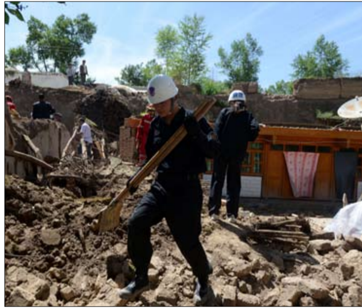
لانزو طوال الليل نحو الجنوب للوصول الى منطقة الكارثة ورفض العديد من المسعفين القادمين من المقاطعات المجاورة التوقف خلال الليل للاستراحة من اجل الوصول في اسرع وقت ممكن والانضمام الى عمليات البحث عن ناجين.

أدى تفجير مركز للشرطة الليبية بمدينة بنغازي الثلاثاء، إلى تدميرها بشكل تام وإصابة 3 موقوفين بداخله باصابات متفاوتة الخطورة. وقال الناطق الرسمي باسم الغرفة الأمنية المشتركة في بنغازي، محمد الحجازي، إن انفجاراً وقع في مركز تابع للشرطة الليبية في بنغازي ما أدى إلى تدميره وإصابة 3 موقوفين كانوا بداخله. وأضاف أن قوات الصاعقة الليبية المكلفة بحماية المدينة هرعت إلى مكان الانفجار وشرعت بتنشيط محيط المركز المستهدف وجمع الأدلة ومحاولة تتبع أثار المتفجرين، وتمكنت من ضبط 3 اشخاص يشتبه بضلوعهم بعملية تفجير المركز وأوضح أن الأشخاص المقبوض عليهم كانوا يحملون عبوات ناسفة بحجم نصف كيلوغرام للواحدة ويذكر ان المركز نفسه سبق وتعرض إلى أكثر من هجوم. وإلى ذلك، انسجرت عبوة ناسفة في مجمع محاكم مدينة سرت (450 كلم شرق العاصمة طرابلس) ما أدى إلى اضرام جسيمة بالمبنى وتصعد أجزاء منه.